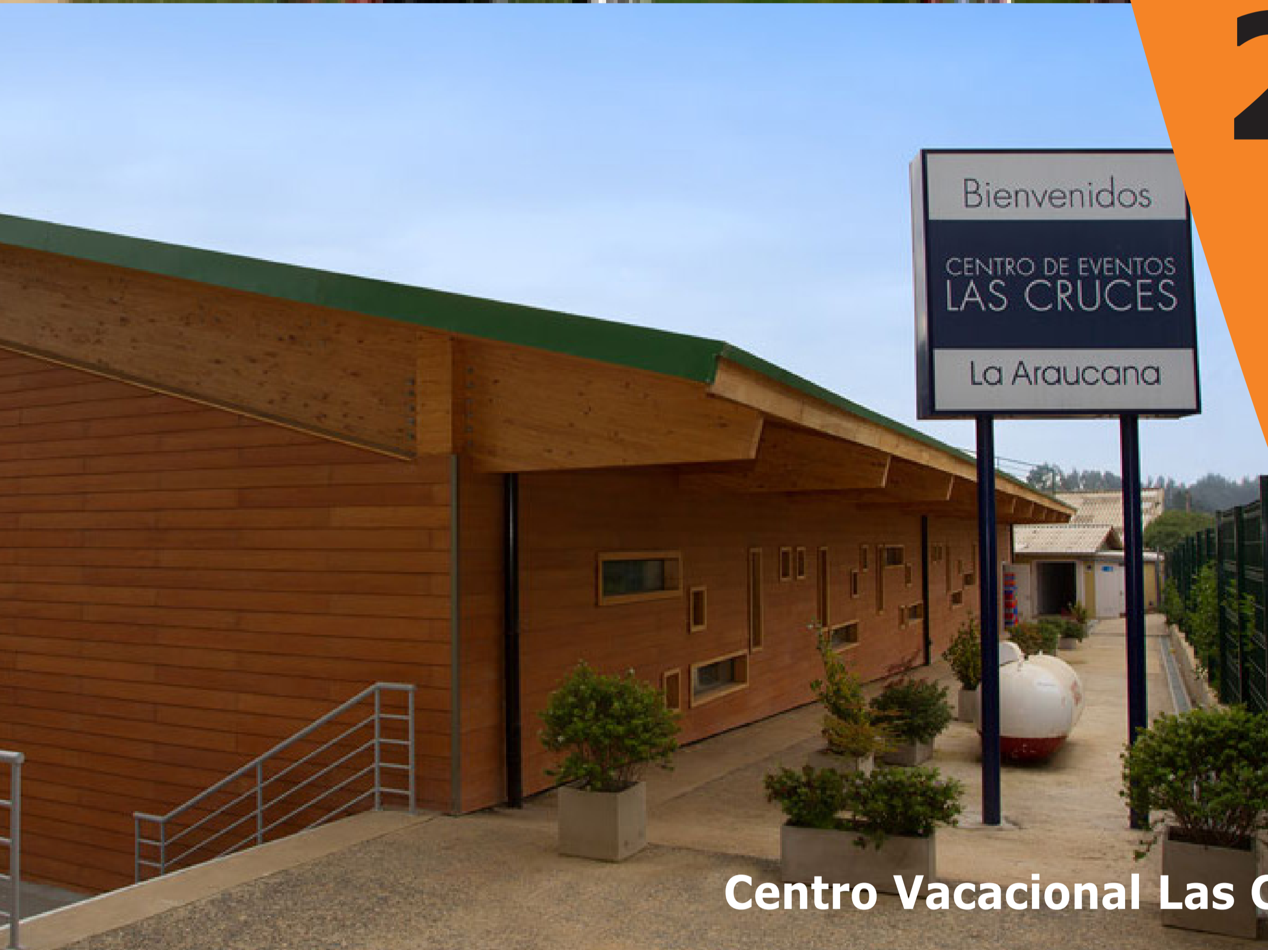
Centro Vacacional Las Cruces