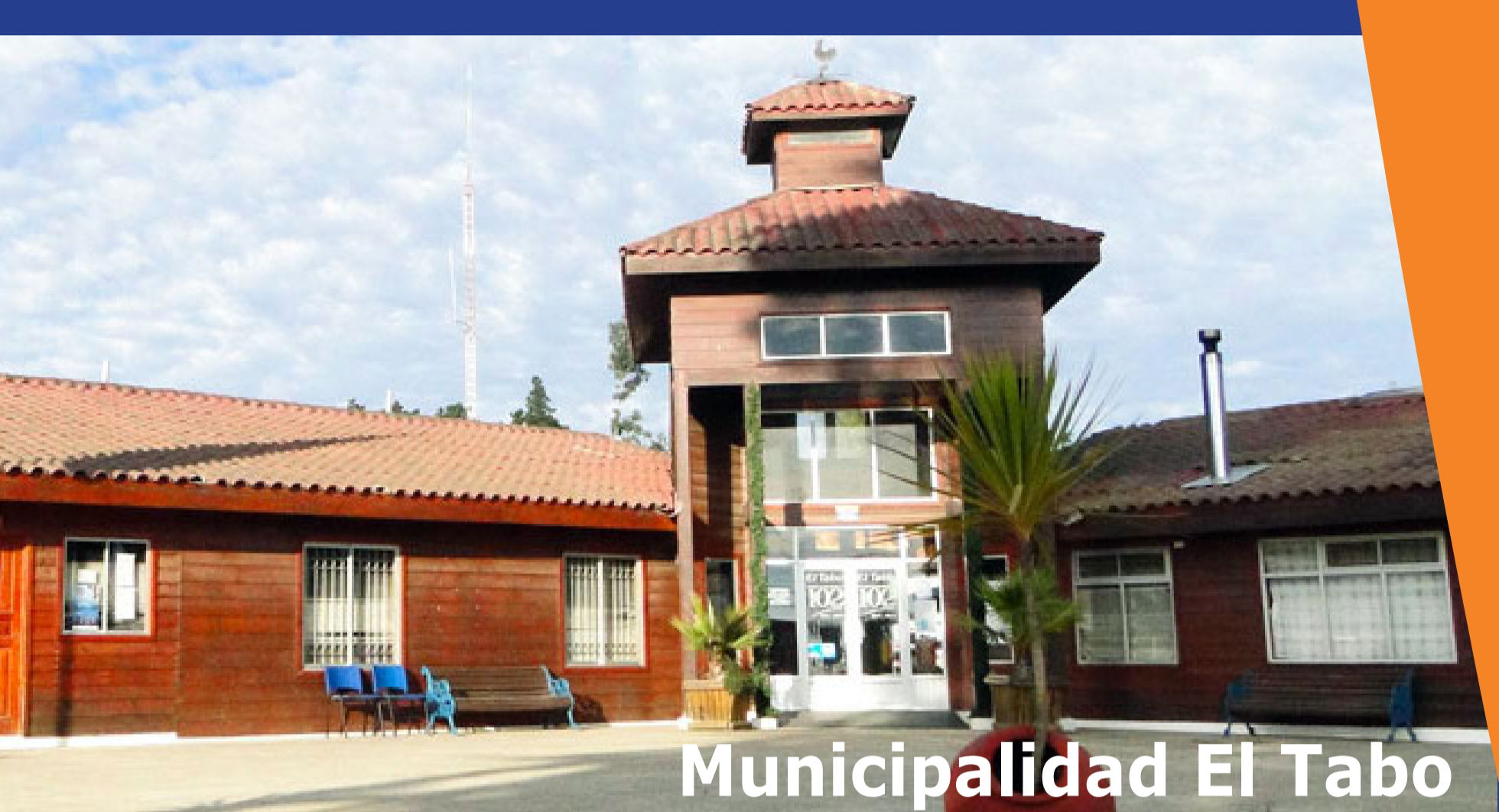
Municipalidad El Tabo

Seminario Nueva Estructura de Planta y Servicios Municipales de Calidad, "Preparandonos para los Nuevos Desafíos".