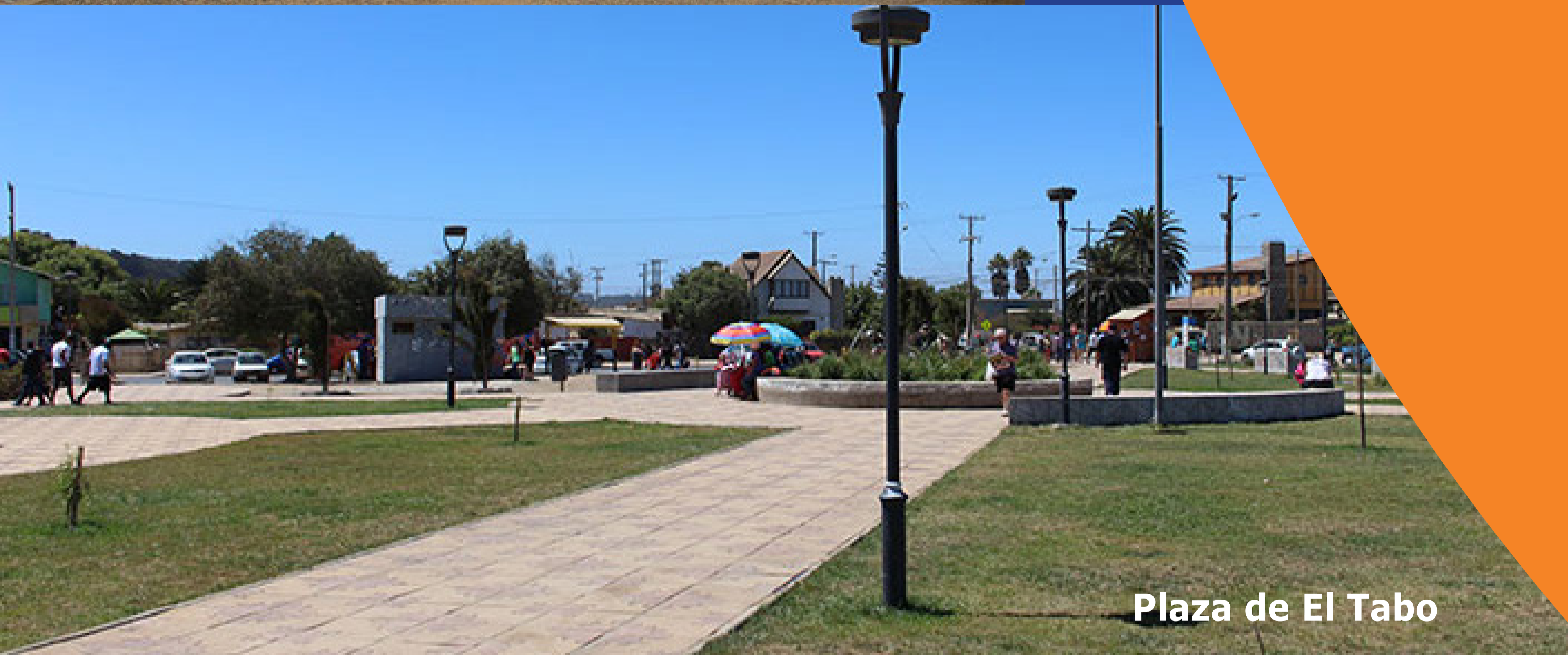
Plaza de El Tabo